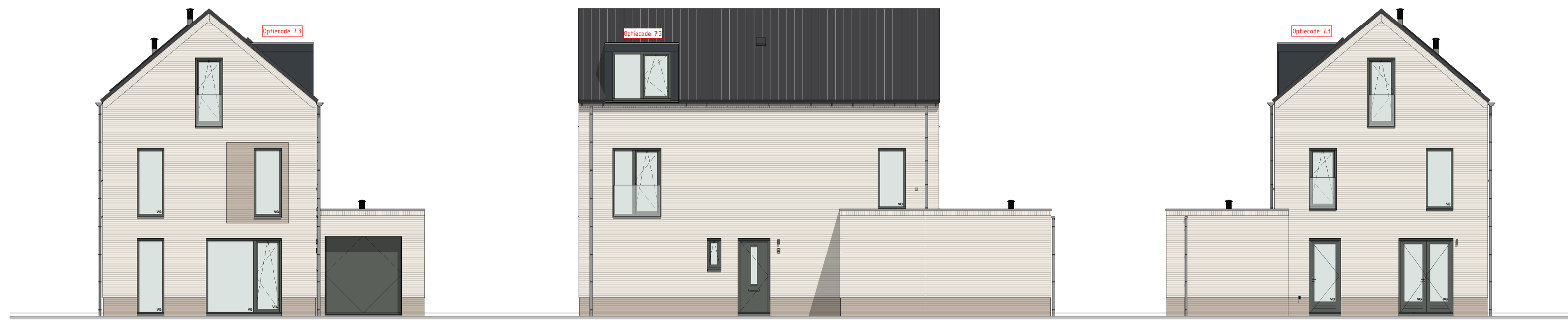
Voorgevel schaal: 1 : 100