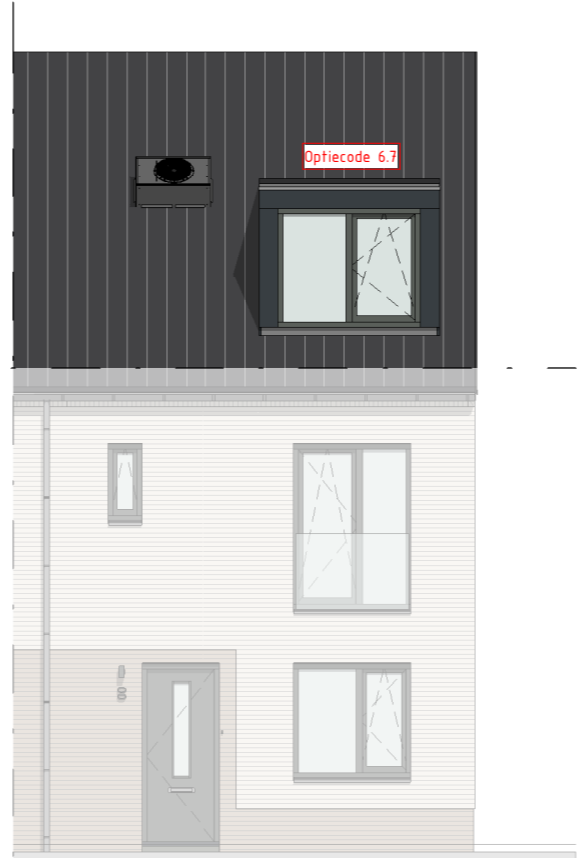
Voorgevel schaal: 1 : 100