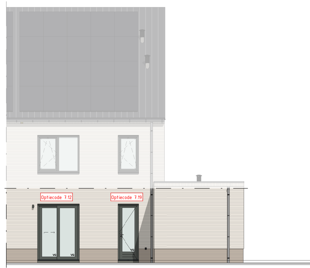
Achtergevel schaal: 1 : 100