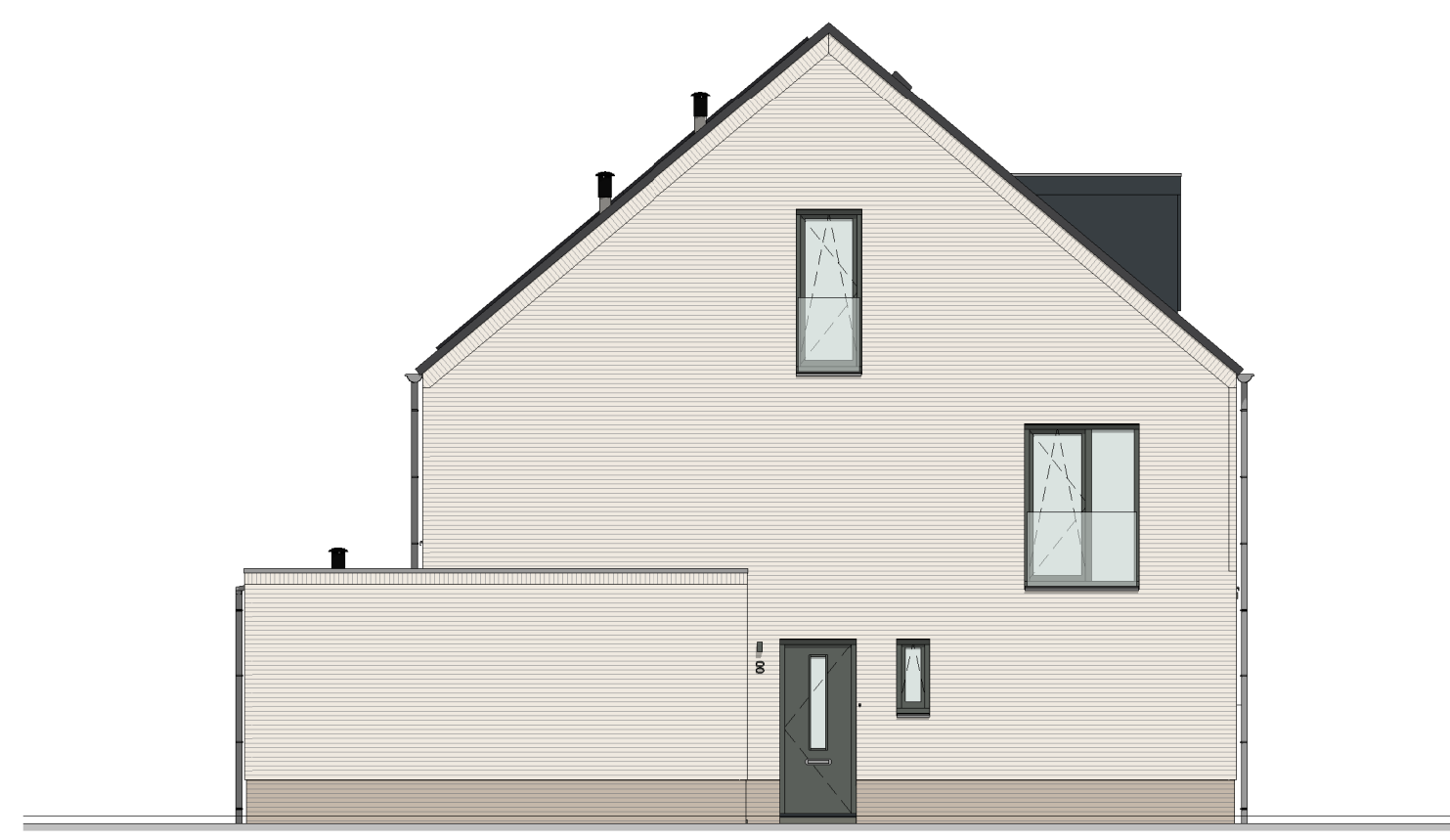
Linker zijgevel schaal: 1 : 100