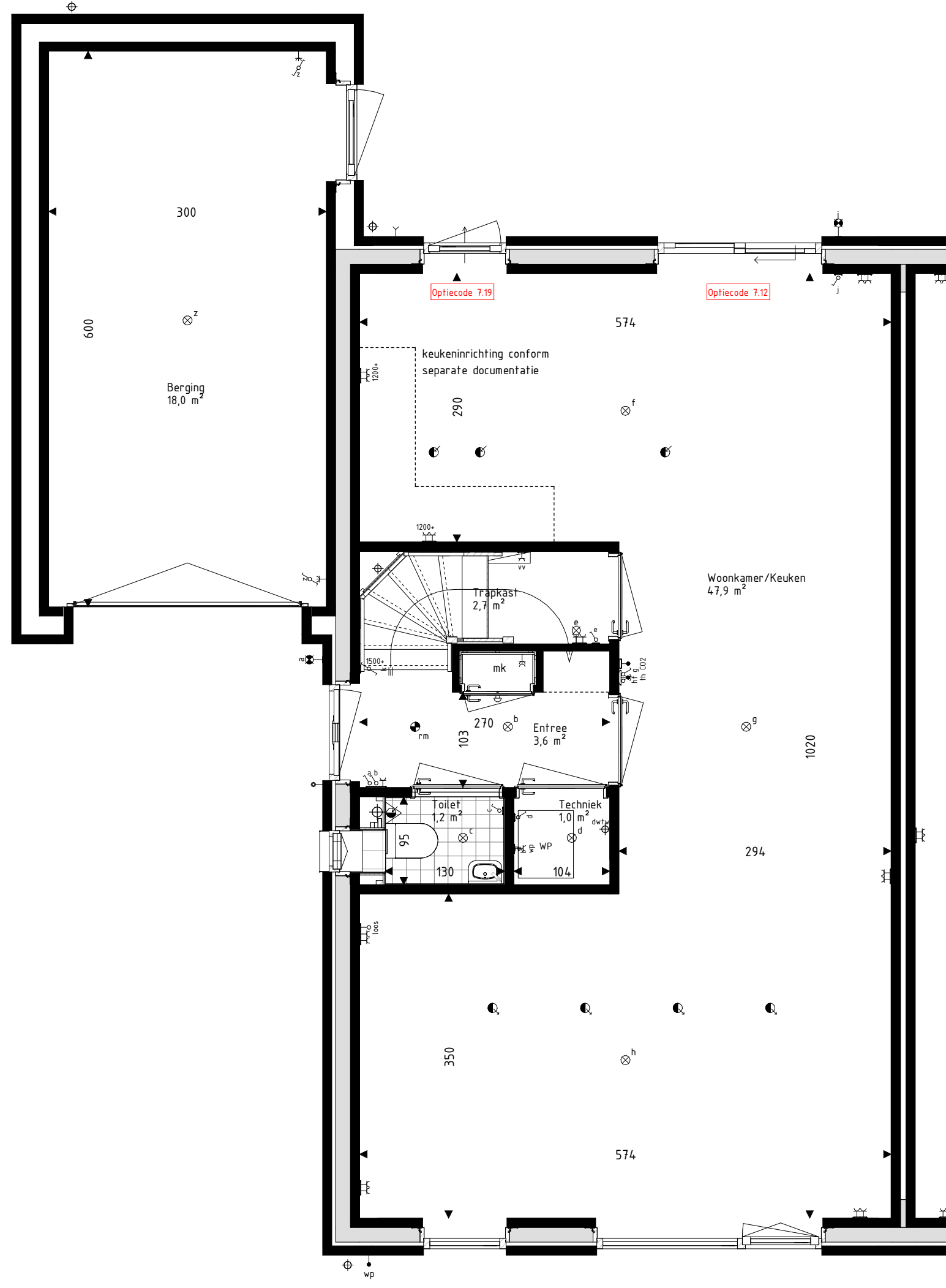
Begane grond schaal: 1 : 50