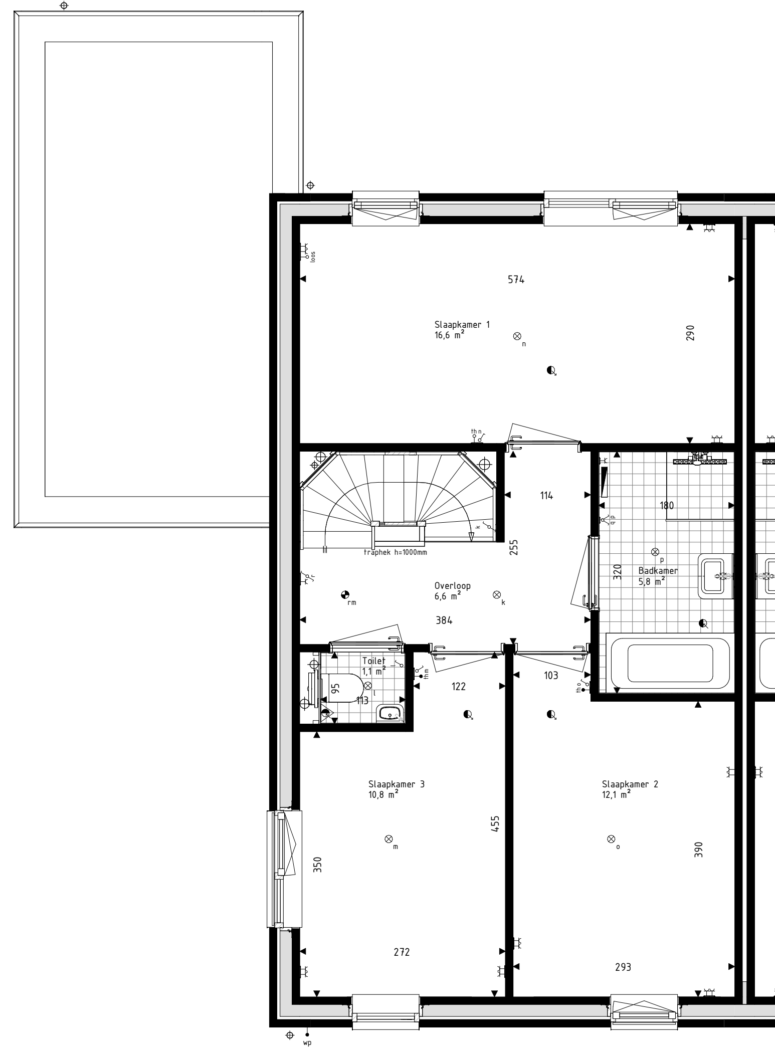
Eerste verdieping schaal: 1 : 50