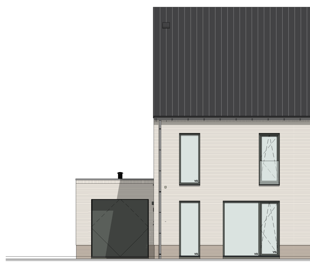
Voorgevel schaal: 1 : 100