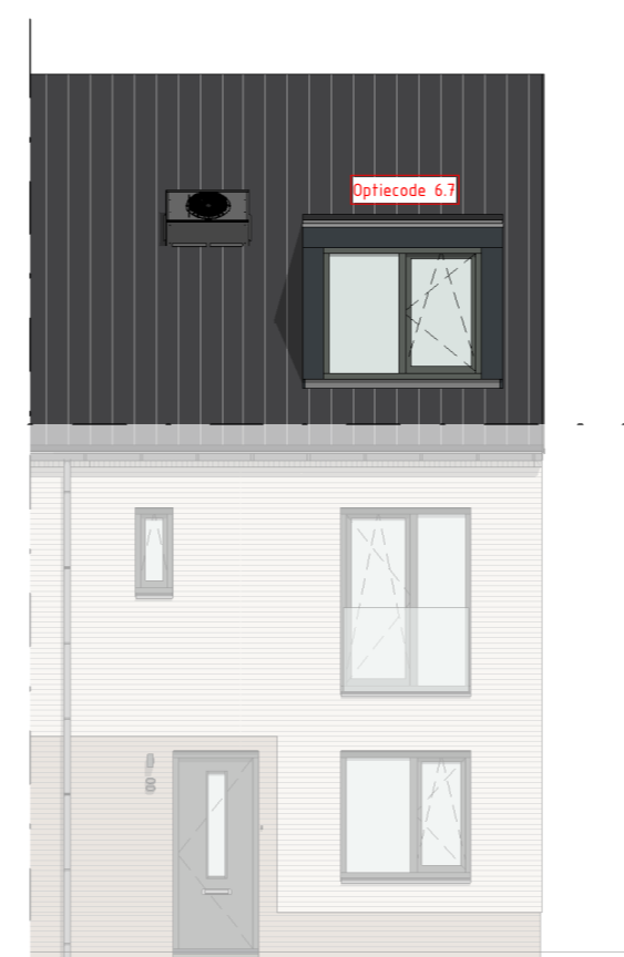
Voorgevel schaal: 1 : 100